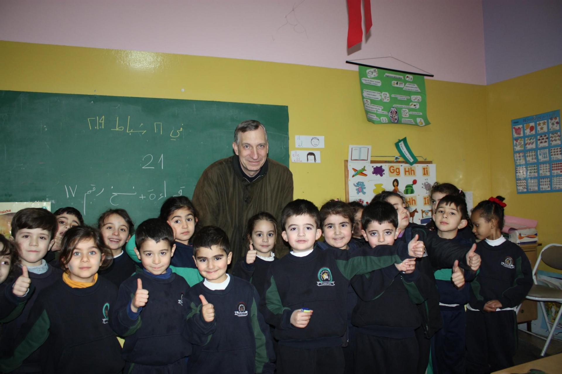
Besuch in der Schule der Schwestern vom Guten Hirten in der Ortschaft Hammana im Schufgebirge.