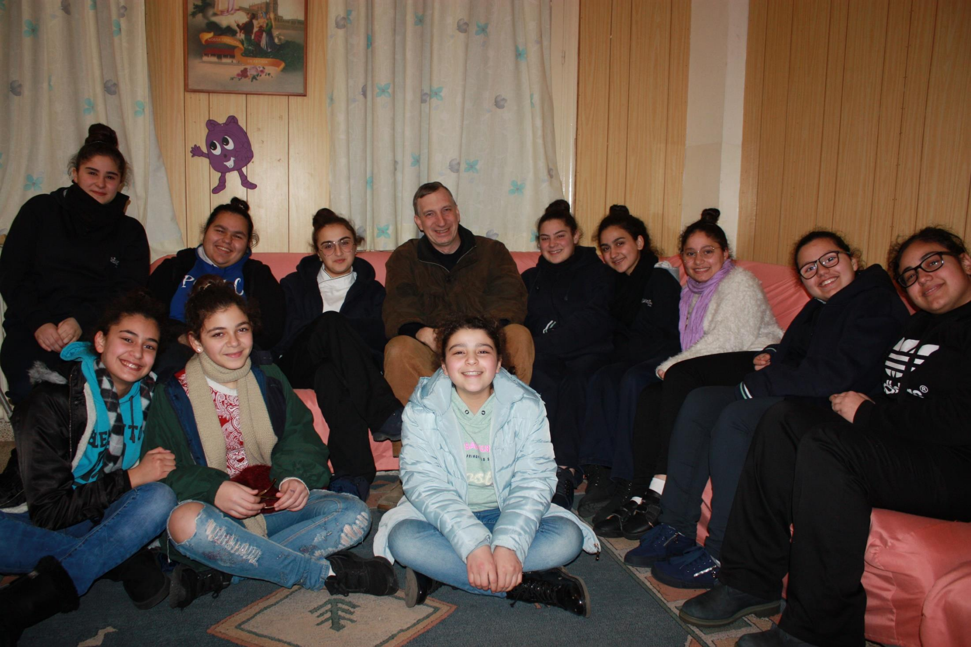
Ein Teil der Kinder lebt hier im Haus in Baskinta im Internat – Besuch im Internatstrakt der älteren Mädchen.