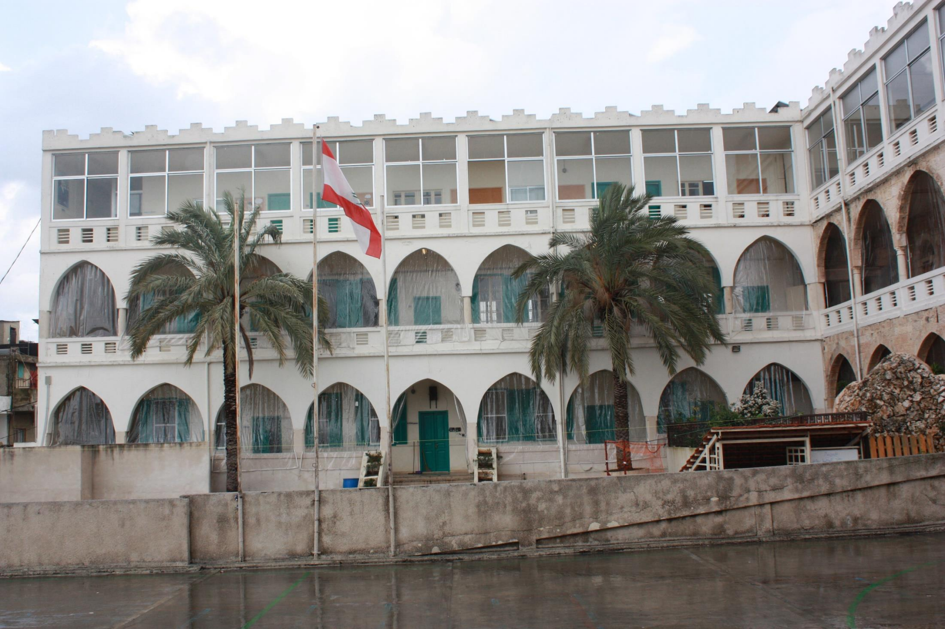
Die Schule der Barmherzigen Schwestern in der Ortschaft Zghorta im Norden des Landes – auch hier hofft man auf Unterstützung durch ICO.