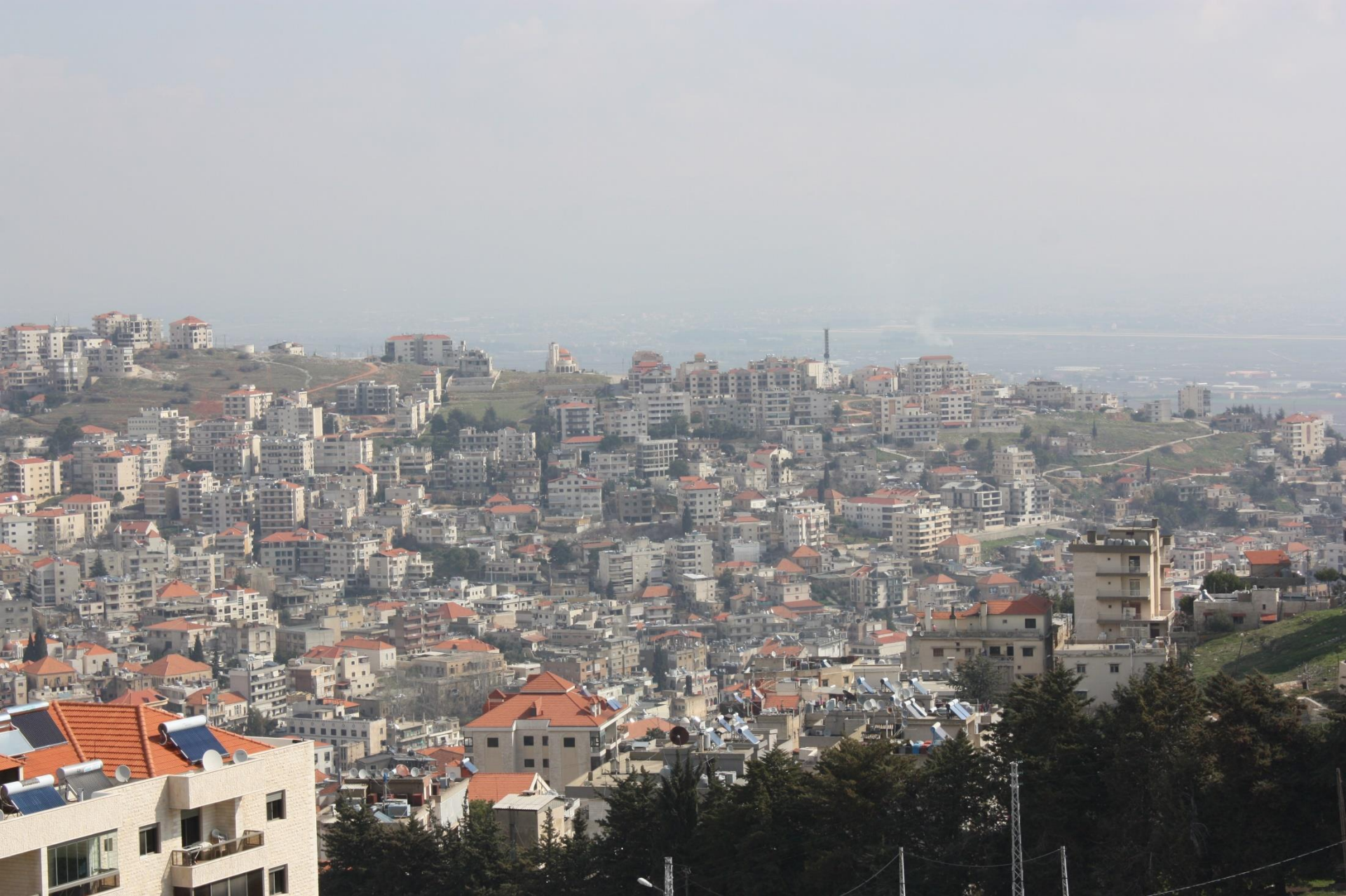
Fahrt über das Libanongebirge nach Zahle, den Hauptort der Bekaa-Hochebene im Osten des Landes.