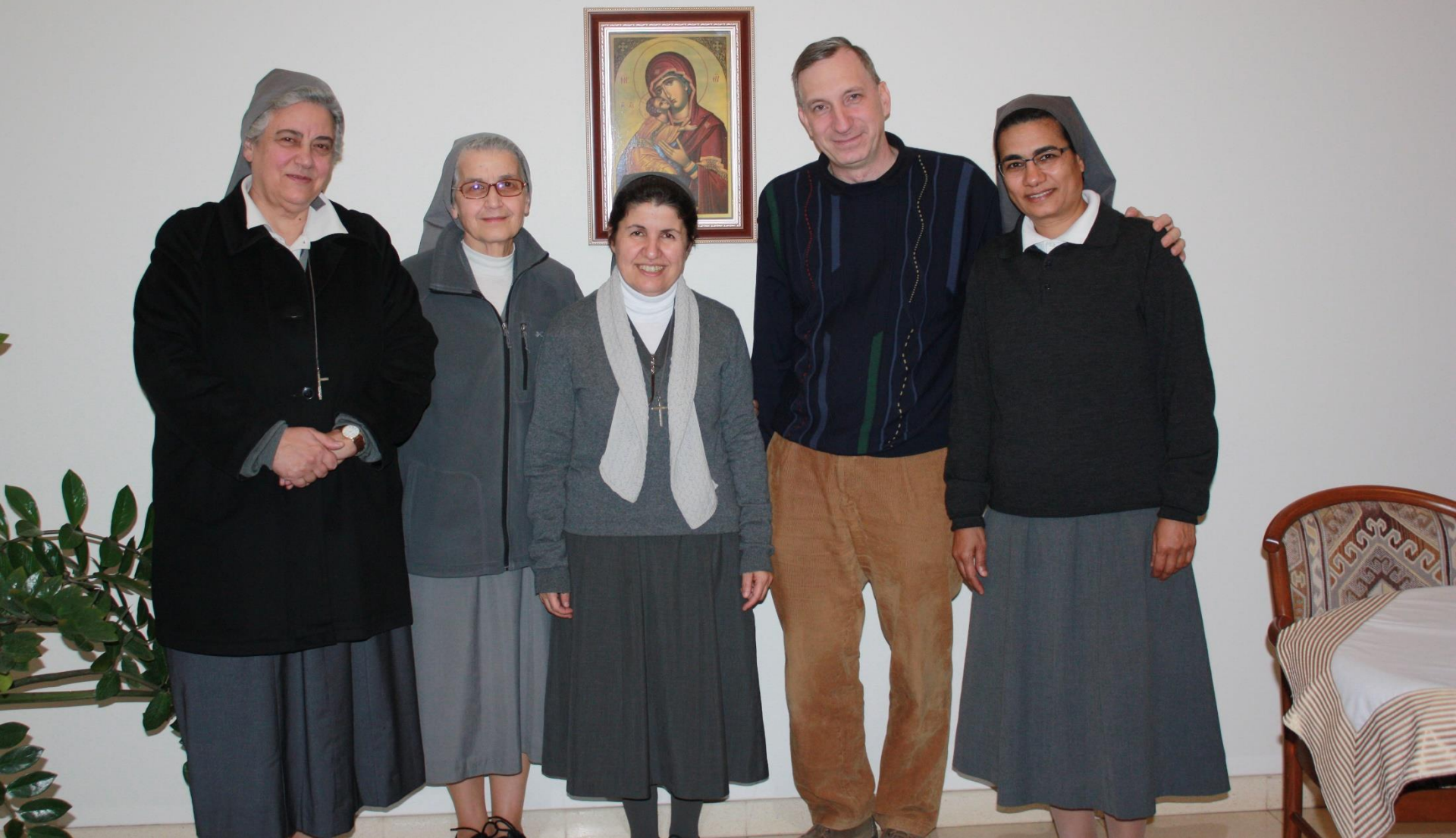
Begegnung mit dem Provinzrat der Barmherzigen Schwestern von Besançon im Provinzhaus des Ordens im Beiruter Stadtteil Baabdath.