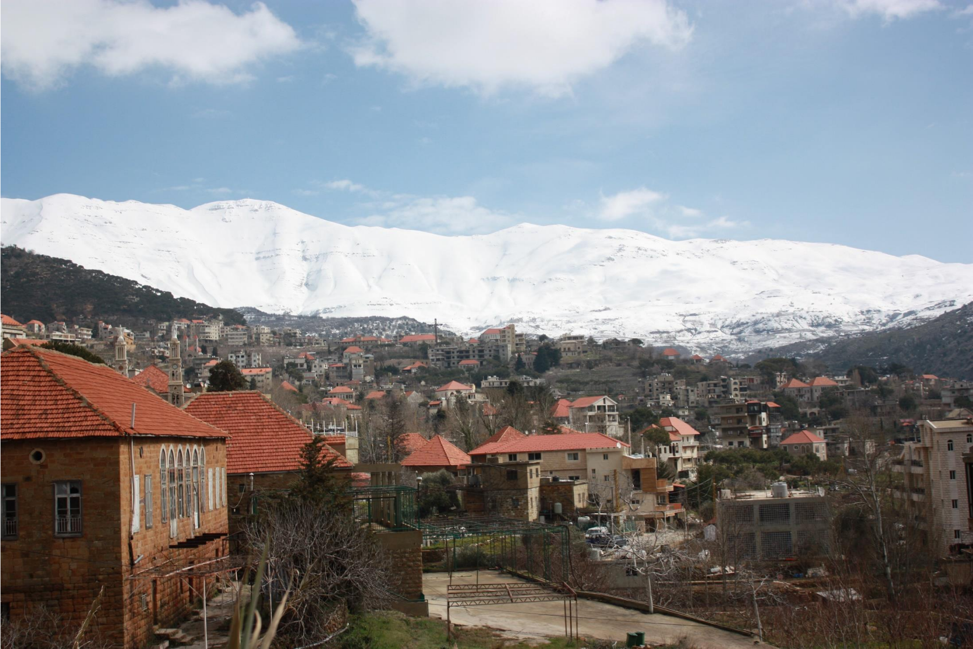
Ankunft im Bergdorf Baskinta mit den typischen roten Dächern – im Hintergrund die schneebedeckten Hänge des Libanongebirges.