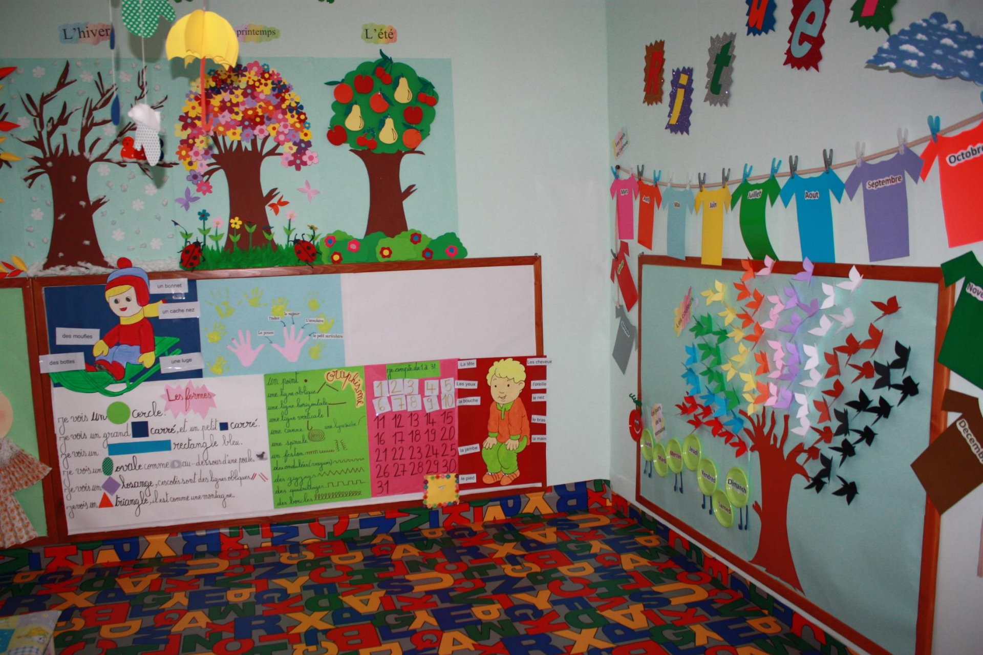
Liebevoll und mit großem Einsatz gestaltete Wanddekorationen im neuen Kinderhort – die Kleinen sollen sich hier wohlfühlen...